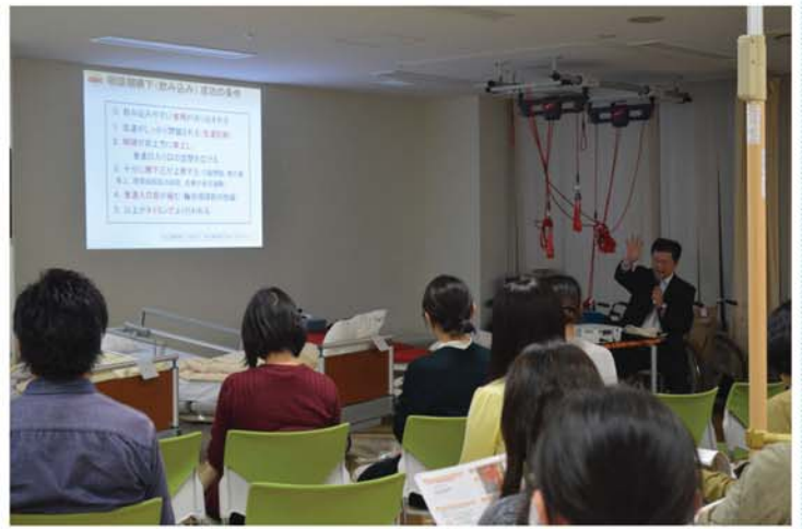
【立川中央病院にて】