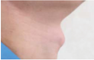
↑ 嚥下した瞬間に喉仏が上に挙がります。

嚥下反射（飲み込み）は基本、喉の上下運動で確認して下さい。嚥下反射がわかりにくかったり、口の中に残っている場合があるので、時々口の中も確認して下さい。