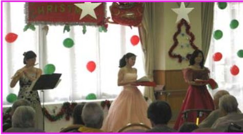
アマービレによる ピアノ・フルートの演奏と合唱

2組のボランティアによる出し物と職員の出し物。そしてサンタよりプレゼントが渡されました。