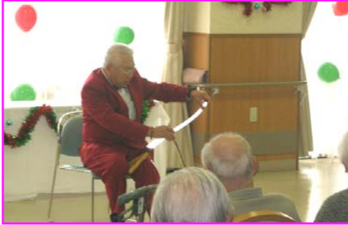
ウエノコによるノコギリを使った演奏