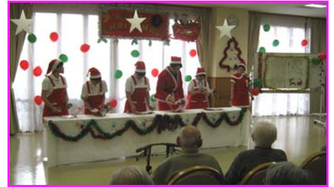
職員によるハンドベルの演奏