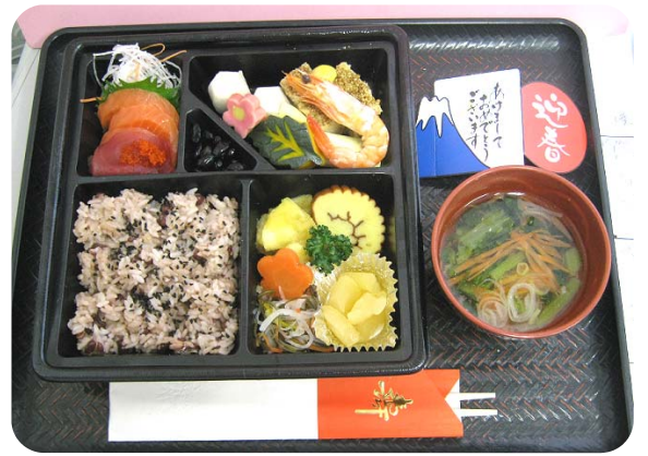
平成22年, 元日の昼食です。

今年もアルカディアでは行事食として元日より3日間、昼食にお節料理をお出ししました。